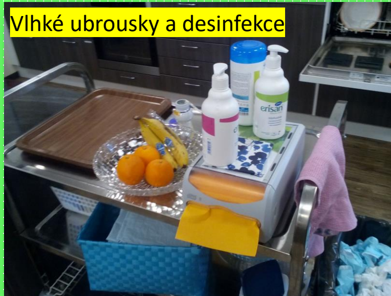
Vlhké ubrousky a desinfekce