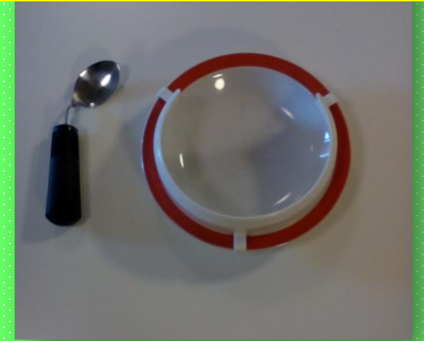
Nástavec na talíř a speciální lžička