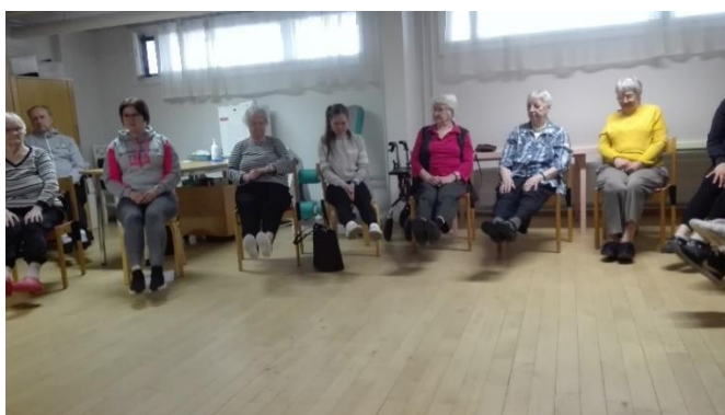
Snímek č. 2 - seniory při aktivizačním cvičení