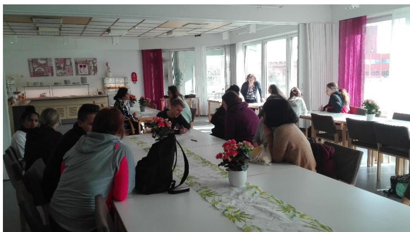
Snímek č. 1 - diskuse žáků nad tématem aktivizace seniorů v obou zemích

Vlastní praktická část zahraniční stáže začala setkáním našich žáků s finskými v domově seniorů, kde měli provádět aktivizaci jejich klientů. Nejdříve se všichni shromáždili v jídelně domova seniorů, ve které byli rozděleni do dvojic podle národností. Při diskusi hledali, které aktivity se seniory se provádějí v obou zemích stejně a v čem se liší. Poté se setkali se seniory, se kterými strávili dopolední program. Nejvíce nás asi zaujalo vystoupení finské studentky s čínskými kořeny, která se seniory cvičila tai chi.