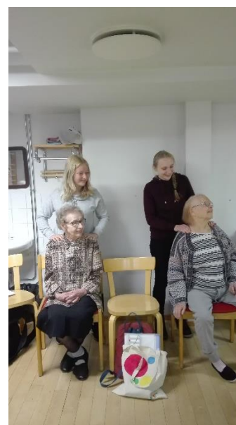
Snímek č. 2 - naše žákyně provádějí masáž

Odpoledne jsme absolvovali exkurzi v nemocnici v Jyväskylä.