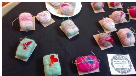
Výrobky hendikepovaných žáků

Po prohlídce školy vystoupili naši stážisté s prezentací o České republice a představili český vzdělávací systém zdravotnických pracovníků. Od finských spolužáků se na oplátku dozvěděli, jakým způsobem probíhá vzdělávání zdravotníků v jejich zemi.