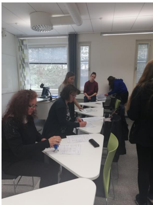
Certifikace finskou partnerskou školou