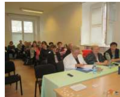
Komise pro teoretickou část