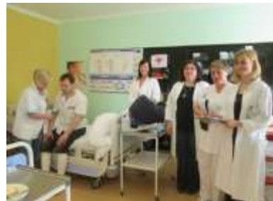
Komise pro praktickou část - kabinet B