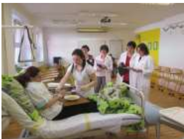
Komise pro praktickou část - kabinet A