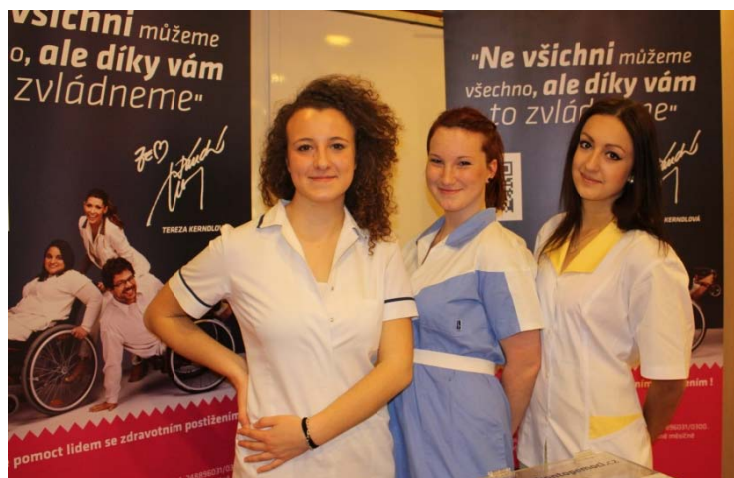
Celostátní přehlídka MOSTY, pořádaná NRZP ČR, se uskutečnila dne 20. března 2014 v hotelu Pyramida, naše žákyně pomohly jako hostesky